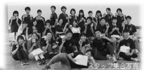
スタッフ集合写真