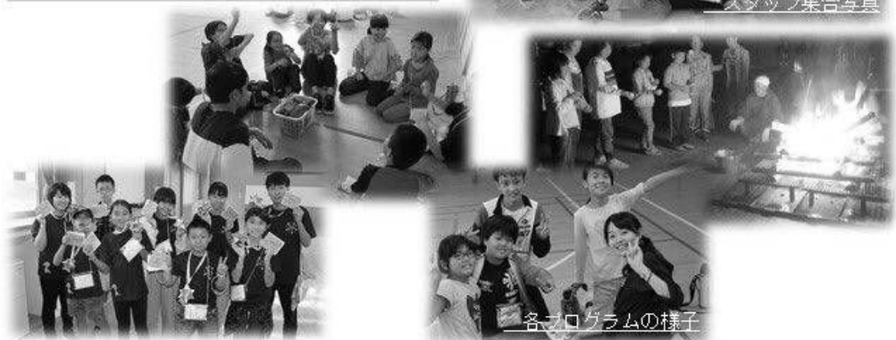
各プログラムの様子