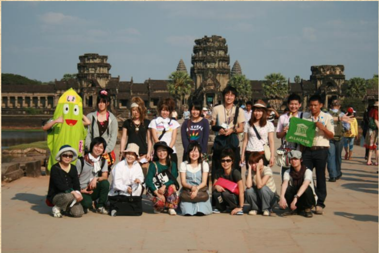
岐阜県ユネスコ協会青年部『結』