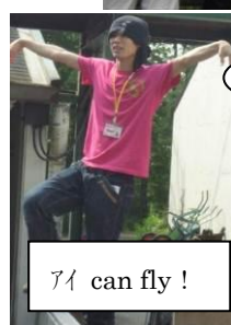
アイ can fly !