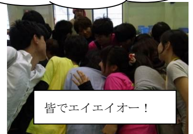
皆でエイエイオー！