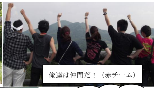
俺達は仲間だ！(赤チーム)