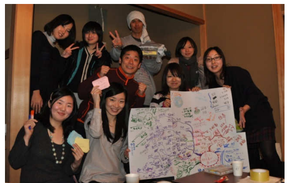
作成：松浦慎(奈良ユネスコ協会)